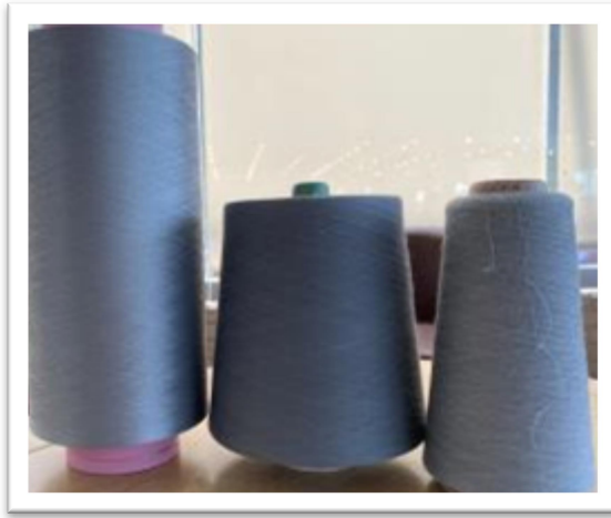
石墨烯長纖 75/72 T/C 短纖